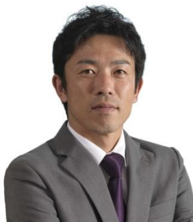
赤星 憲広（あかほし のりひろ） 野球評論家