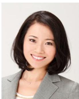
小島 智子 (こじま ともこ) 元NFLチアリーダー 日本人初チームキャプテン

愛知県出身。2001年、阪神タイガースに入団、1年目に盗塁王と新人王を獲得。セ・リーグ記録となる5年連続盗塁王に輝き、ベストナイン2回、ゴールデン・グラブ賞6度受賞。2009年、試合中のダイビングキャッチで脊髄を損傷し、同年、現役を引退。現役時代は、盗塁した数の車椅子を病院や施設に寄贈。引退後も「Ring of Red～赤星憲広の輪を広げる基金」を設立し、社会貢献に力をそそいでいる。車いすの寄贈活動、野球界発展を目指した野球チーム設立など、自身のあらゆる経験から、現在では野球評論家として、各種メディアに出演している。2012年より、大阪マラソンの提携マラソンでもある「Ring of Red 交野市チャリティマラソン 2012」を交野市と共催。第2回大阪マラソンチャリティランナー。