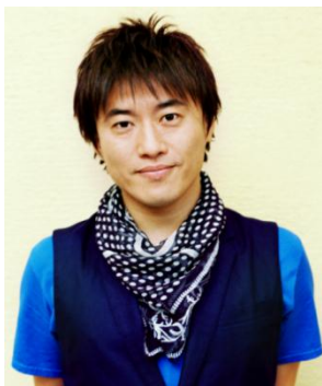
小渕 健太郎（こぶち けんたろう） ミュージシャン コブクロ